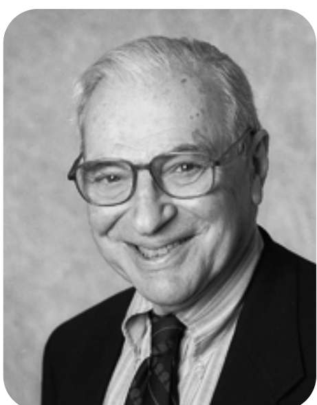
Kenneth Arrow, économiste américain

La comparaison deux à deux des candidats ne dépend pas de la présence ou de l’absence d’autres candidats dans la compétition.