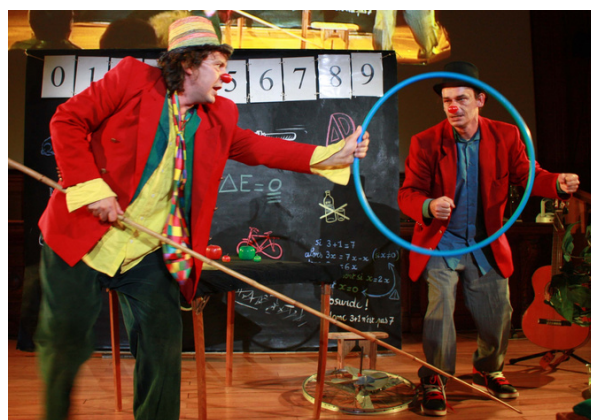
Spectacle: compagnie Ile logique

Cinéma: Man Ray, un facétieux photographe surréaliste installé à Montparnasse, découvre dans une armoire oubliée de la Sorbonne de curieuses sculptures géométriques. ... En bon surréaliste, il va sublimer ces équations-objets, et les faire résonner avec les mythes du plus grand auteur dramatique de tous les temps.