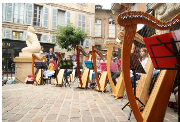
Musiciennes de l'école Harpes en Piste .